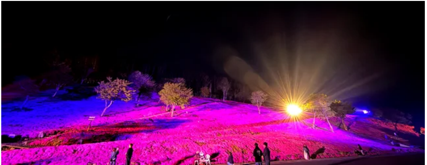
ライトアップされる芝ざくら滝上公園

2026年5月21日（木）から5月23日（土）までの3日間、芝ざくら滝上公園にて開催された本イベントは、当初の想定を大幅に上回る総来場者数約1,600名を記録いたしました。地域の新たな夜間観光（ナイトタイムエコノミー）コンテンツとしての確かな手応えを得て、大盛況のうちに幕を閉じましたことをご報告いたします。